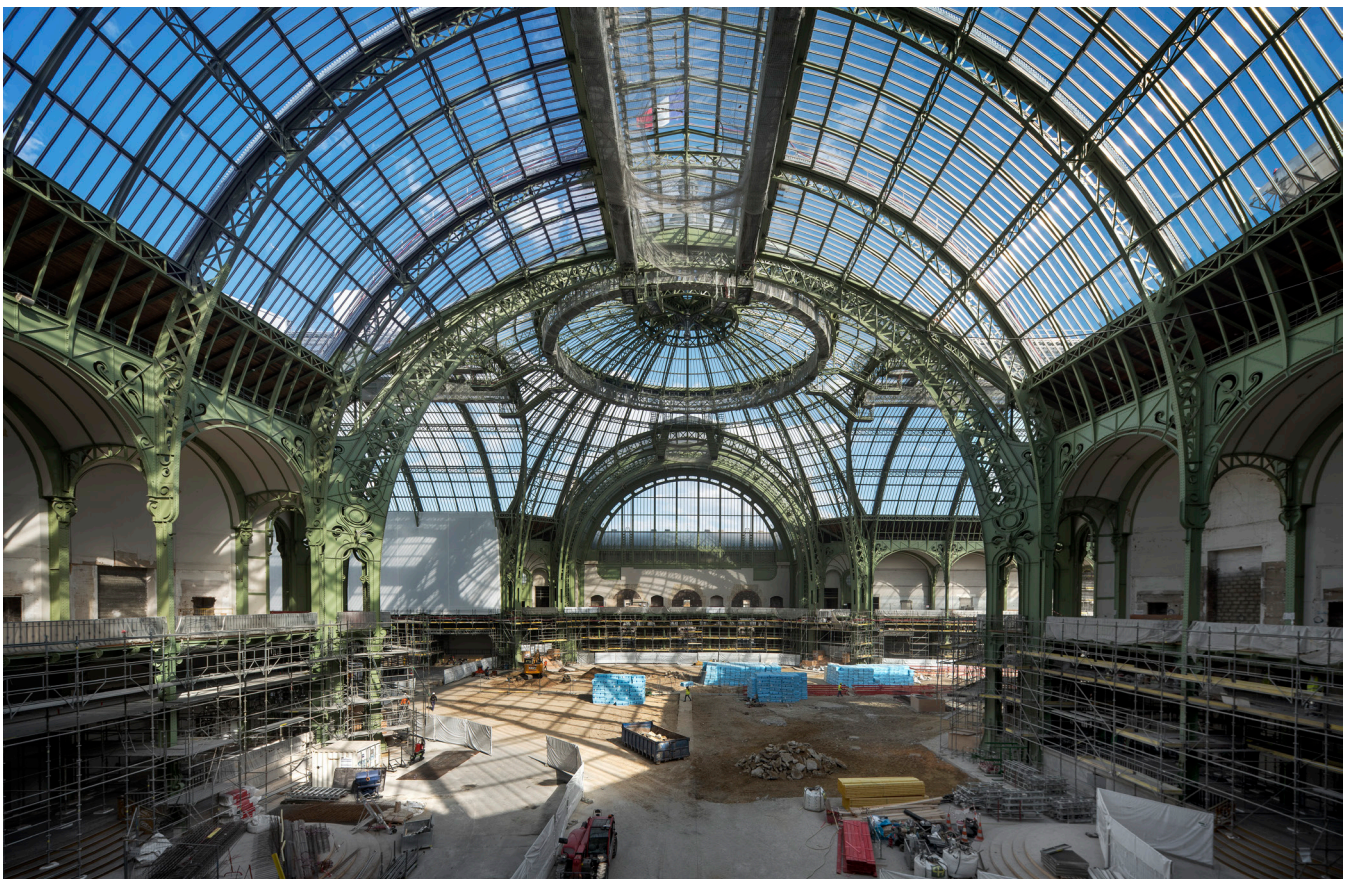
Le chantier du Grand Palais © Patrick Tourneboeuf chez Tendance Floue pour la Rmn-Grand Palais, Paris 2022

Cet ambitieux projet qui a démarré en 2021 est prévu pour s'achever en 2024 pour la Nef et les galeries qui l'entourent afin d'accueillir les épreuves des Jeux Olympiques de Paris, et au printemps 2025 pour le reste du monument.